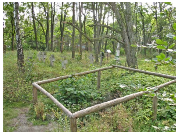
Fot. 6. Monaterz – pozostałości klasztoru, cmentarza wojennego i ukraińskiego. Photo 6. Remains of monastery, war and Ukrainian cemetery.