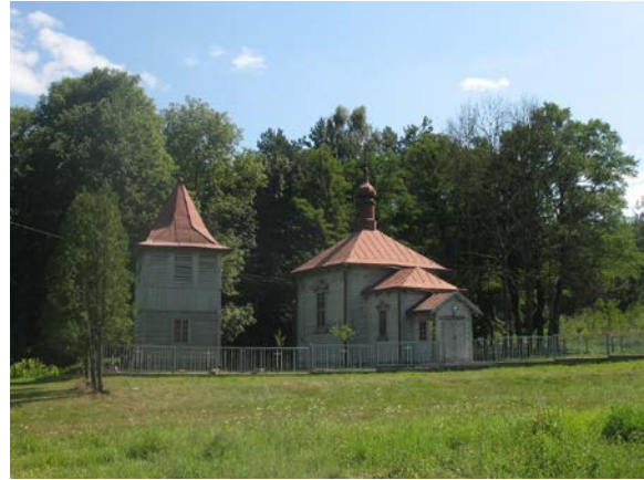
Fot. 2. Zespół cerkiewny (obecnie kościół) w Potoczku. Photo 1. Orthodox complex (currently church) in Potoczek.