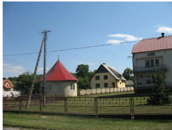
Fot. 4. Otoczenie kaplicy św. Onufrego w Krasnobrodzie. Photo 4. Surrounding of St Onufry chapel in Krasnobród.