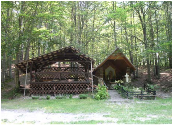
Fot. 3. Otoczenie zabytkowej kaplicy w Nowinach Horynieckich. Photo 3. Surrounding of historic chapel in Nowiny Horynieckie.