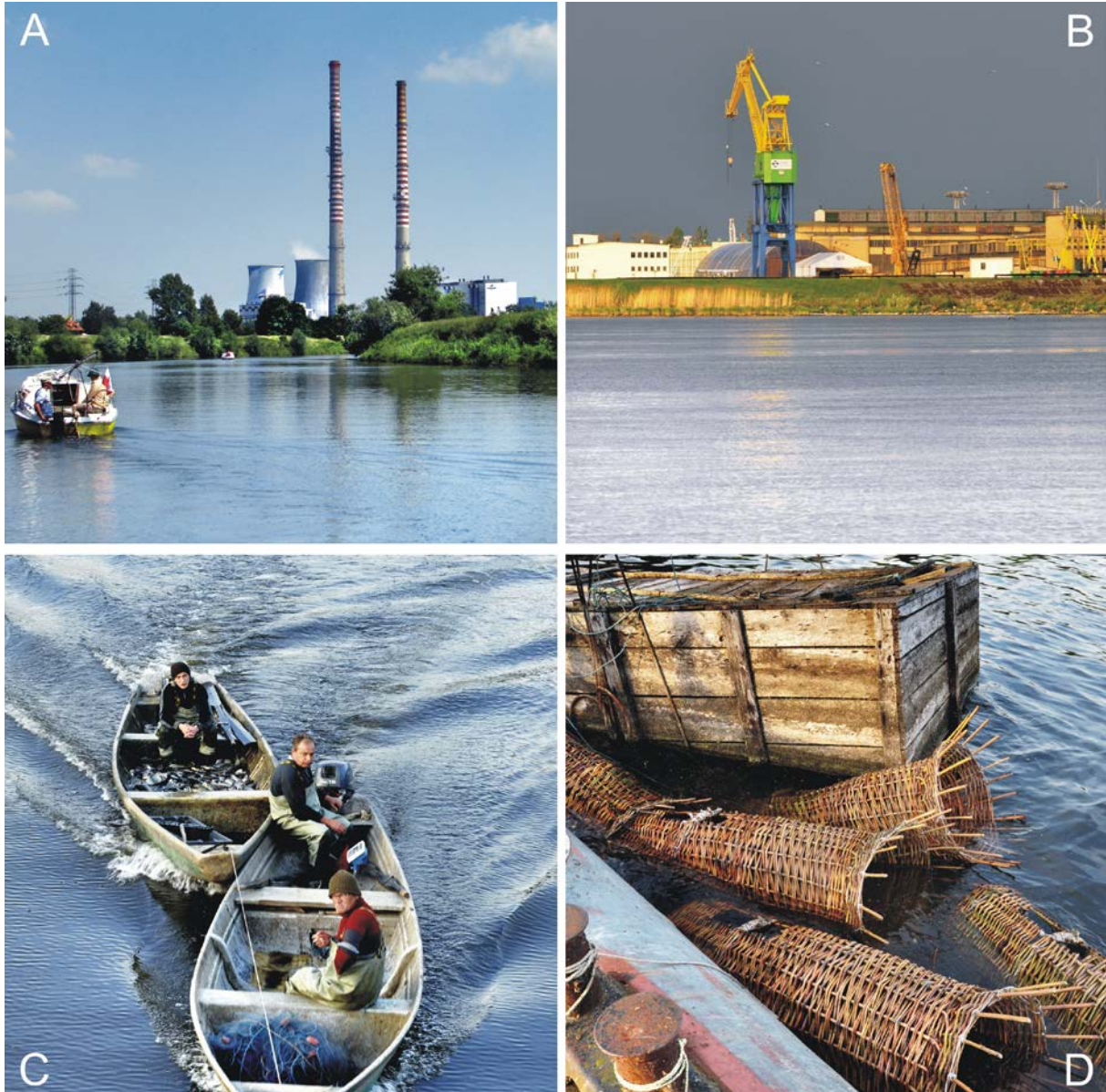
Fot. 1. Znaki sfery profanum w przestrzeni rzeki.

Sfery: sacrum i profanum mogą się czasem pokrywać, tworzyć „wyspy” czy też „zatoki”. Dzieje się tak dlatego, ponieważ sfera sacrum jest tą, która jest tworzona przez umysł człowieka. Niektórzy autorzy wydzielają zarówno „czystą” sferę sacrum (np. kościoły, cmentarze) jak i quasi-sakralną (np. kapliczki, krzyże tworzące wspomniane wyspy czy zatoki sfery sacrum w sferze profanum (Madurowicz, 2002: 64).