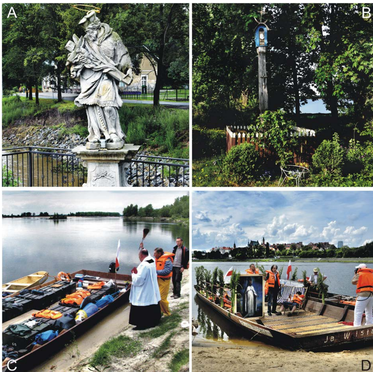
Fot. 2. Znaki sfery sacrum w przestrzeni rzeki.

A. Figura św. Jana Nepomucena nad Bystrzycą Dusznicką (Szalejów Dolny, woj. dolnośląskie); B. Kapliczka przydrożna (fundowana przez rybaków) u wejścia do byłej przystani na Wiśle (Murzynowo, woj. mazowieckie); C. Święcenie krypy wiślanej (Wróble-Wargocin, woj. mazowieckie); D. Odnowienie tradycji pochodzącej z wieku XVII – w Dzień Zielonych Świątek obraz św. Bonifacego płynie na łodzi Wisłą od Zamku Królewskiego w Warszawie do byłego klasztoru oo. Kamedułów na warszawskich Bielanych.