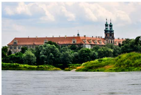
Fot. 8 / Photo 8