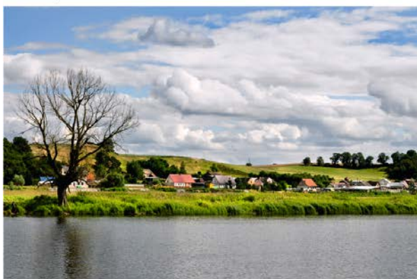
Fot. 9 / Photo 9