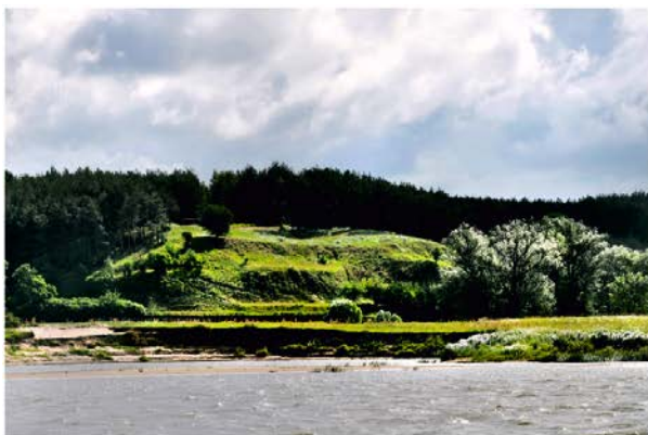
Fot. 1 / Photo 1