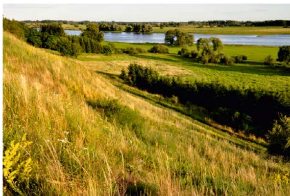
Fot. 2 / Photo 2