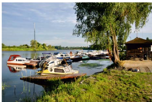
Fot. 12 / Photo 12

Fot. 7. Krajobraz kulturowy osadniczy – wiejski. Szachulcowy dom ponemiecki (Siekierki, pow. gryfiński).