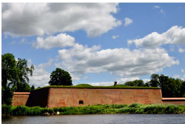
Fot. 5 / Photo 5