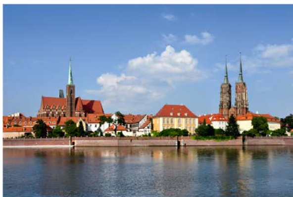
Fot. 6 / Photo 6