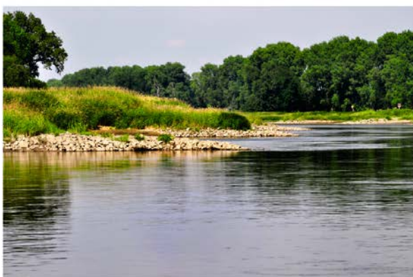
Fot. 3 / Photo 3