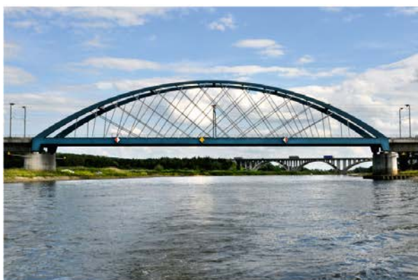
Fot. 11 / Photo 11