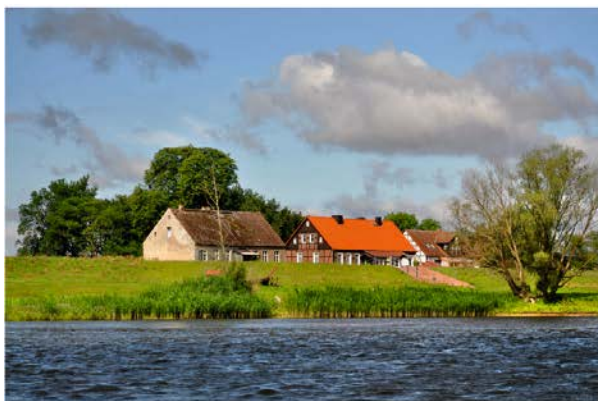
Fot. 7 / Photo 7