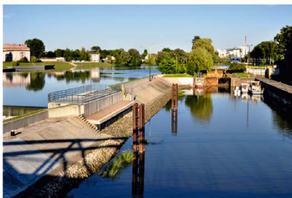
Fot. 4 / Photo 4