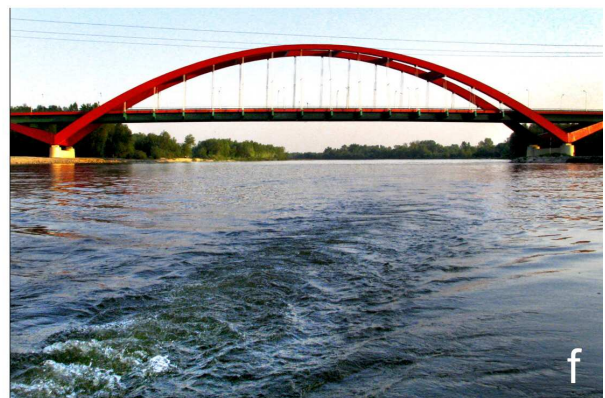
Fot. 2. Przykłady współczesnych elementów krajobrazów kulturowych postrzeganych z perspektywy rzeki Wisły: obiekty przemysłowe, hydrotechniczne, komunikacyjne (objaśnienia w tekście).