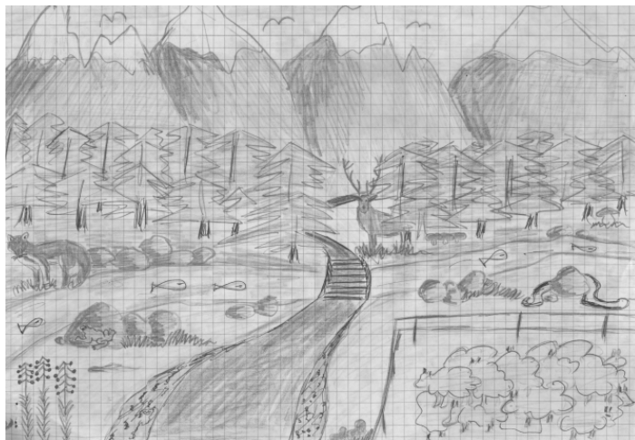
Ryc. 1. Ilustracja krajobrazu idealnego do opisu 2.

Jest to krajobraz przeze mnie wyobrażony. Dzieciństwo spędziłam w mieście”.