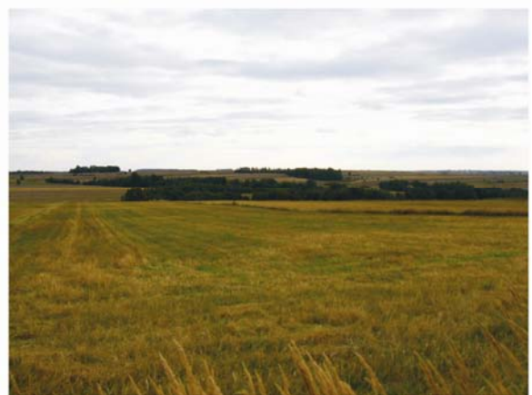
Fot. 1. Miejsca walk z czasów I wojny światowej: „Mogiła” (Giełczew i Tarnawka, gm. Wysokie - A i B) oraz pola bitwy w Podizdebno, gm. Żółkiewka (C i D).