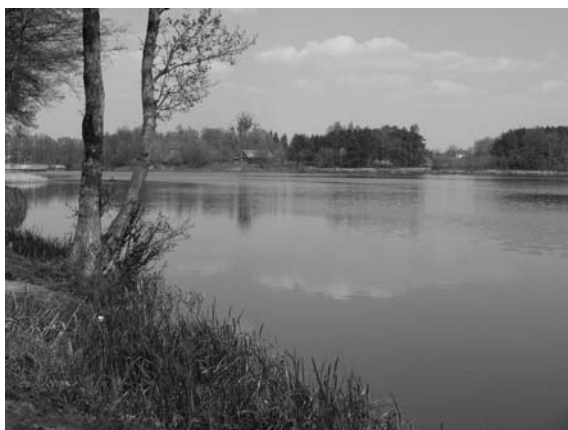
Fot. 7. Staw Górny. Photo 7. Upper Lake.

że jednym wielkich plusów miasta jest istnienie w nim skupisk drzew o charakterze leśnym oraz dużych obszarów leśnych na terenach przemysłowych.