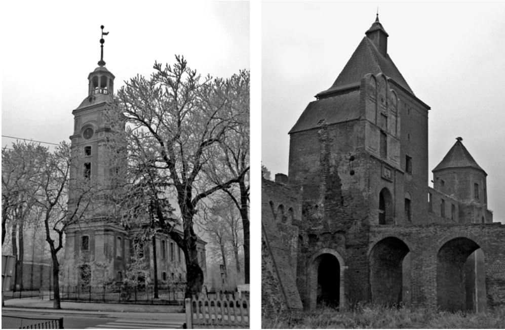
Fot. 1, 2. XVIII wieczny kościół w Kamieńcu i ruiny zamku w Szymbarku.