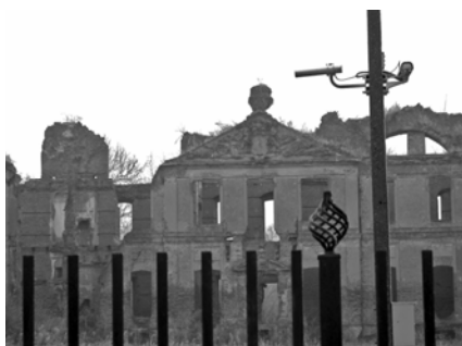
Fot. 10. Ruiny pałacu w Kamieńcu..

Photo 10. The ruins of the palace in Szymbark.