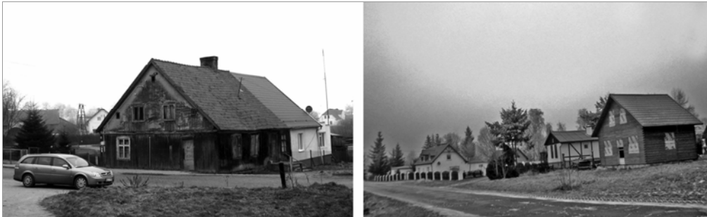
Fot. 5, 6. Problemy z nową zabudową na terenie parku (Przezmark, Siemiany). Photo 5, 6. Problems with a new building (Przezmark, Siemiany).