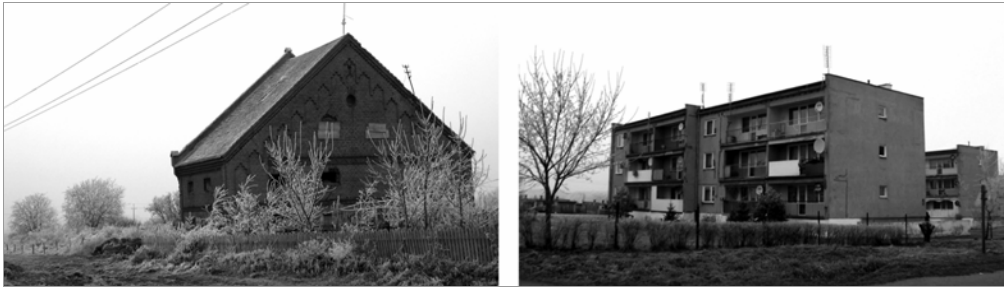
Fot. 3, 4. Przykład zróżnicowania zabudowy na terenie parku (Olbrachtówko, Kamieniec). Photo 3, 4. An example of the complexity of the building (Olbrachtówko, Kamieniec).