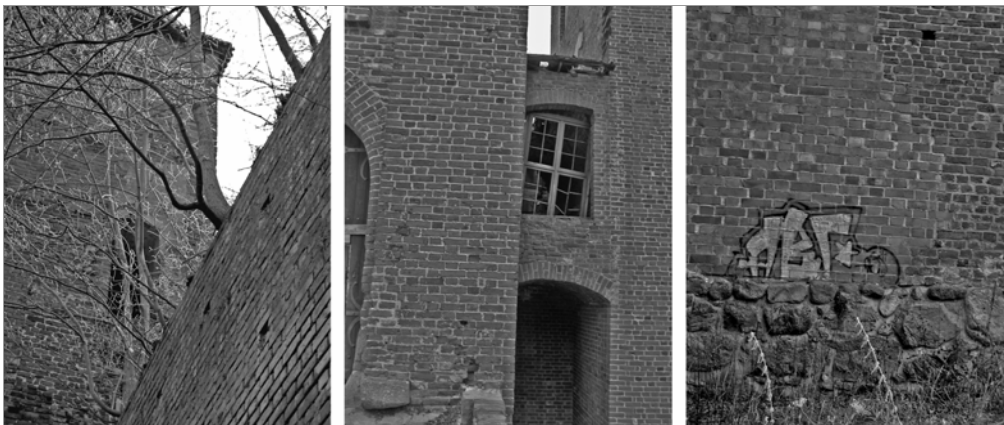
Fot. 7, 8, 9. Rezultat braku czynnej ochrony krajobrazu kulturowego (zamek w Szymbarku). Photo 7, 8, 9. The consequence of the lack of an active protection of the cultural landscape (the castle in Szymbark).

Wszystkie fot. M. Antolak, 2007. All photos by M. Antolak, 2007.