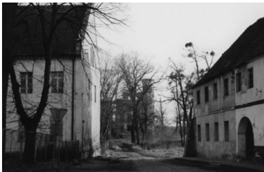
Fot. 1. Ulica wiodąca do zamku w Urazie. (fot. Z. Borcz).

Obecnie pojawiły się propozycje urządzenia przystani dla kajaków i łodzi, a tym samym powiązania Urazu szlakami rowerowymi i wodnymi z Wrocławiem i dalej z miastem powiatowym Brzegiem Dolnym. Sprzyja temu przedsięwzięciu piękna okolica, przybrzeżna przyroda nadodrzańska, m.in. chronione siedliska konwalii.