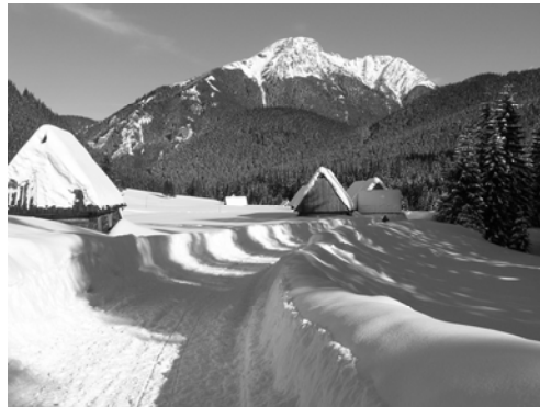
Fot. 2. Unikatowy krajobraz przyrodniczo – kulturowy Tatry Wyzna Polana

Photo 1. Unique cultural composed landscape of Zamość. The World Hderitage List of UNESCO –the potential cultural park.