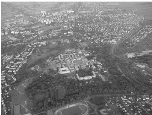
Fot. 1. Unikatowy krajobraz kulturowy komponowany Zamościa. Lista UNESCO – potencjalny park kulturowy.

Photo 1. Unique cultural composed landscape of Zamość. The World Hderitage List of UNESCO –the potential cultural park.