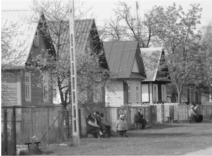
Fot. 1. Charakterystyczna zabudowa wschodniopodlaskiej wsi (Plutycze w gm. Bielsk Podlaski). (fot. J. Szewczyk, 2001). Photo 1. The built environment of a village of the east part of the Podlasie region (Plutycze in Bielsk Podlaski commune). (photo by J. Szewczyk, 2001).