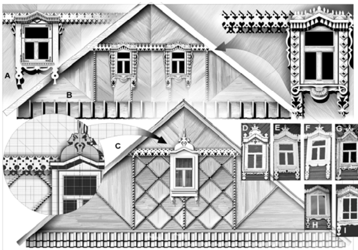
Ryc. 3. Ornamentyka wiejskiego budownictwa Białostoczczyzny (szczyty domów we wsi Wojszki w gm. Juchnowiec, i w okolicach). Fig. 3. The examples of wooden adornments of country houses in the Białystok region (gables in Wojszki, Juchnowiec commune, and its surroundings).