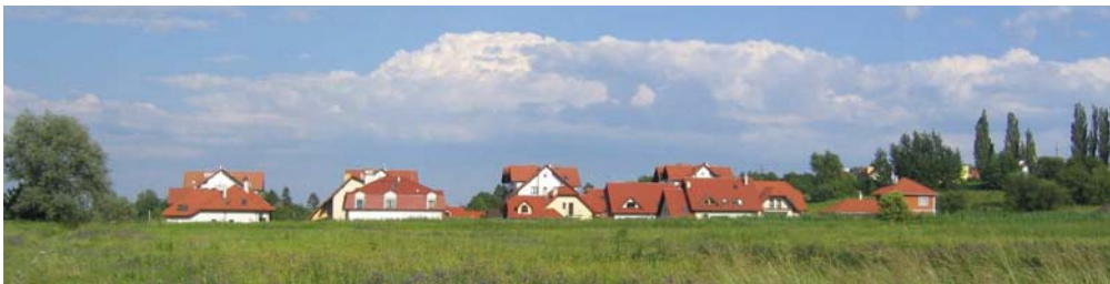
Fot. 4. Jednorodność w zakresie kompozycji, materiału, koloru i skali zabudowy oraz zróżnicowanie w zakresie kształtu dają odczucie harmonii wizualnej zespołu – Chełm, przedmieście Krakowa.