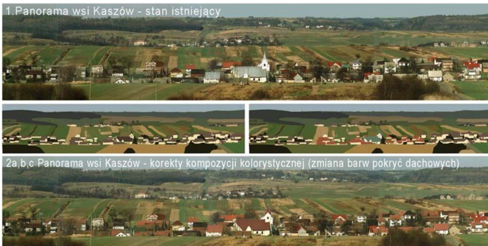
Fot. 1. Korekty kolorystyczne w skali zespołu architektoniczno- krajobrazowego – skala wsi (na przykładzie podkrakowskiej wsi Kaszów). Photo 1. Correction of color composition in the scale of architectural- landscape unit – village scale – on the example of Kaszów (near Cracow).